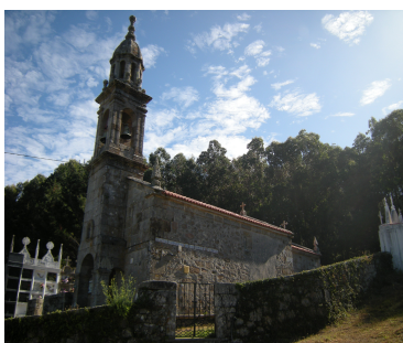
Igrexa de S. Martiño de Touriñán