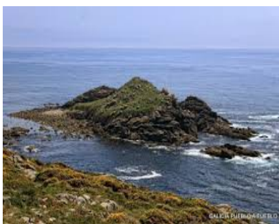
Illote do castelo